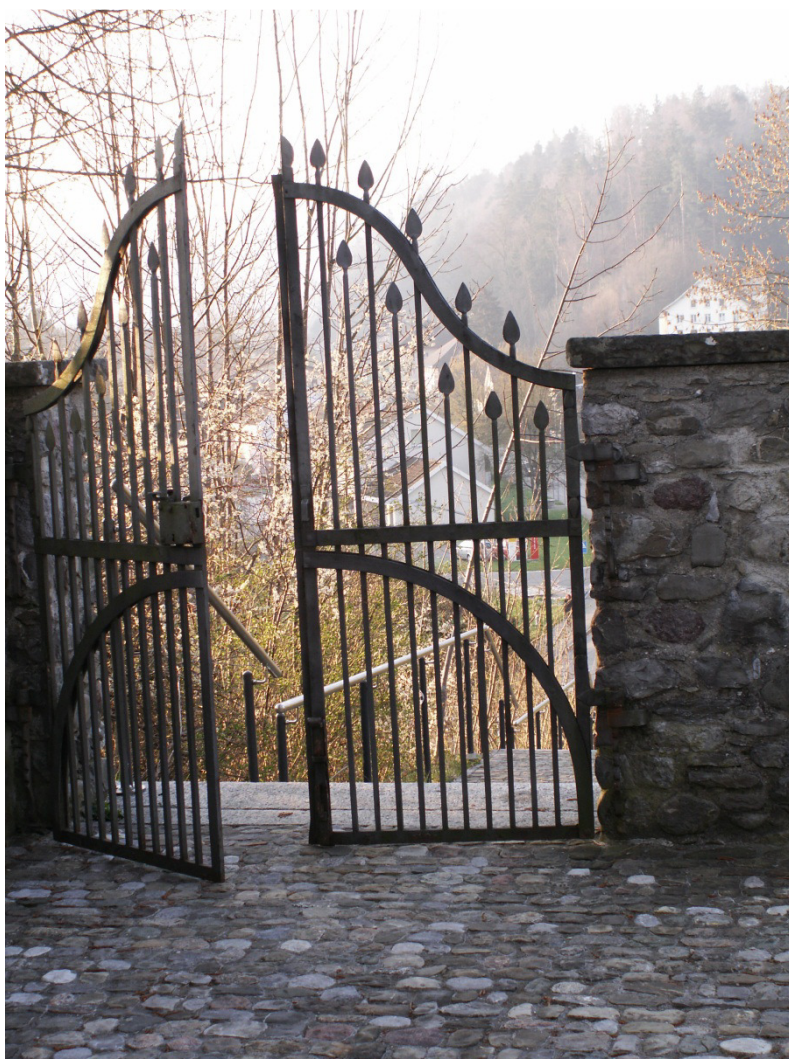
Eingang zum Friedhof Wila

Und vergessen Sie nicht, das Bestattungsamt Wila nimmt Ihnen viele der bevorstehenden organisatorischen Aufgaben ab.