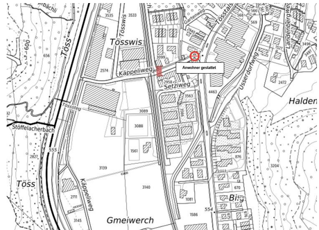
Abbildung 1: Verkehrsanordnung Käppeliweg, Turbenthal

Der Käppeliweg in Turbenthal wird ab der Verzweigung Tösstalstrasse mit dem Signal «Verbot für Motorwagen und Motorräder» mit dem Zusatz «Anwohner gestattet» signalisiert.